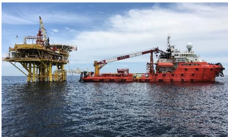
Несчастные случаи на морских объектах