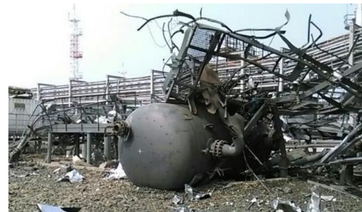
Взрывы, разрушение конструкций