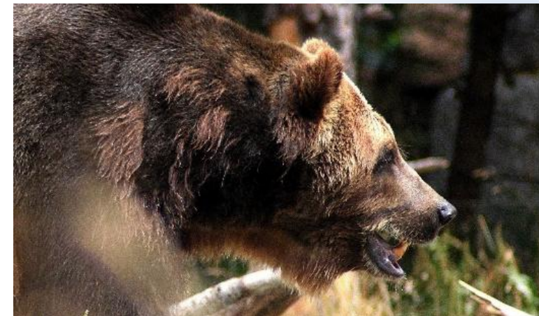
Нападение диких зверей