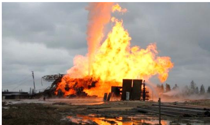
ГНВП, разрушения газонефтепроводов