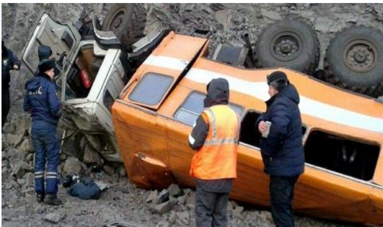
Несчастные случаи на транспорте