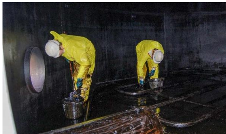
Отравления в токсических средах