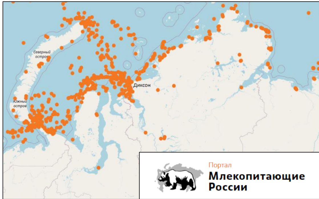
Распределение зарегистрированных особей белого медведя